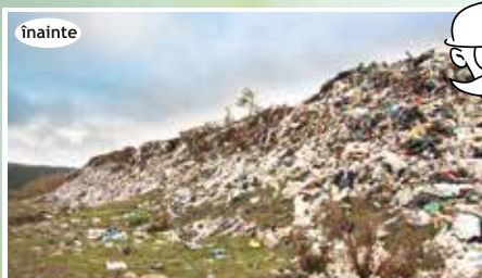
Depozit Întorsura Buzăului, la finalizarea lucrărilor, august 2013; A bodzafordulói hulladéklerakó telep a munkálatok befejezésekor, 2013. augusztus