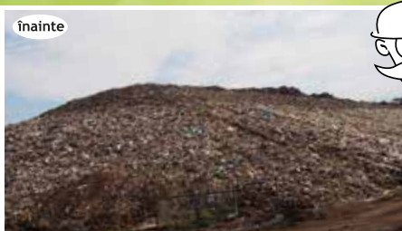
Depozit Târgu Secuiesc, la finalizarea lucrărilor, iunie 2015; A kézdivásárhelyi hulladéklerakó telep a munkálatok befejezésekor - 2015. június